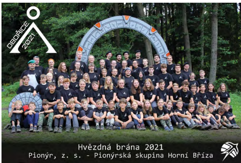
Hvězdná brána 2021 Pionýr, z. s. - Pionýrská skupina Horní Bříza

Počasí nám letos občas nepřálo, přesto jsme si tábor užili a vynahradili si to například diskotékou na planetě Vijaya nebo táborákem s kytarami a houslemi, kterého se zúčastnili také zástupci města z planety Země.