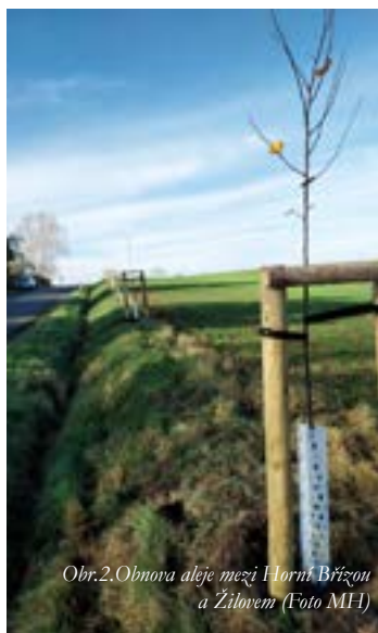
Obr.2. Obnova aleje mezi Horní Břízou a Žilovem

Obnova třešňového stromořadí u KD Klub – Při příležitosti otevření Kulturního domu Klub po rekonstrukci ekologický spolek vysadil řadu třešní u tenisového kurtu.