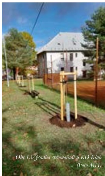
Obr.1. Výsadba stromořadí u KD Klub (Foto MH)

I přes to, že se aktuálně nacházíme stále ještě v období vegetačního klidu, práce se pro ekologický spolek v tomto období najde mnoho. Hlavní cíle spolku jsou mimo jiné podpora biodiverzity, zadržování vody v krajině, výsadba stromů a další. Na konci roku 2023 a začátkem roku 2024 se podařilo zrealizovat některé první projekty: