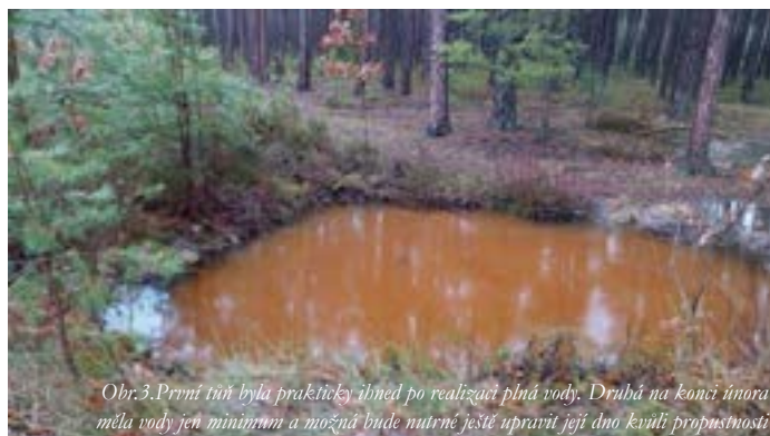
Obr.3. První úprava byla prakticky ukončena po realizaci plánu vody. Druhá na konci února měla vody jen minimum a možná bude nutné ještě upravit její dno kvůli propustnosti

Za důležitou činnost také považujeme prosazování opatření pro zpomalení odtoku vody z naší krajiny. V minulosti členové ekospolku pracovali na budování mokřadu u Červenice. V zimě proběhly lehké úpravy na hrázkách přehrazujících