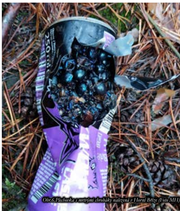
Obr.6. Plechovka s mrtvými chrobáky nalezená v Horní Bříze

Celostátní akce Uklidme Česko letos proběhne v sobotu 6. dubna. S ekologickým spolkem máme v plánu úklid lesa mezi vsí a továrnou naproti bývalé dehtové haldě. Chcete-li se připojit, sraz v 9:00 u sadu Višňovka. Po úklidu bychom ještě provedli několik prací na sadu jako úpravu opor a oploček u stromků, úpravu terénu louky, dosetí lučních květin apod.