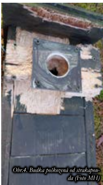
Obr.4. Budka poškozená od strakapouda