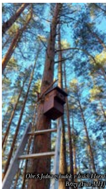
Obr.5. Jedna z budek v lesích Horní Břízy

Podpora míst, kde mohou hnízdit ptáci, je jedna z důležitých aktivit podporujících biodiverzitu. Členové ekologického spolku HB se v současnosti starají o 74 ptačích budek rozmístěných po městském lese. Z důvodu velkého konkurenčního tlaku na omezený počet stromů s dutinami jsou budky jednou z možností, jak rozšířit nabídku pro hnízdění mnoha druhů našich ptáků. Budky se ideálně každý rok musí sundat ze stromů, vyčistit, zaevidovat a a případně opravit poškozené části. To znamená spoustu práce.