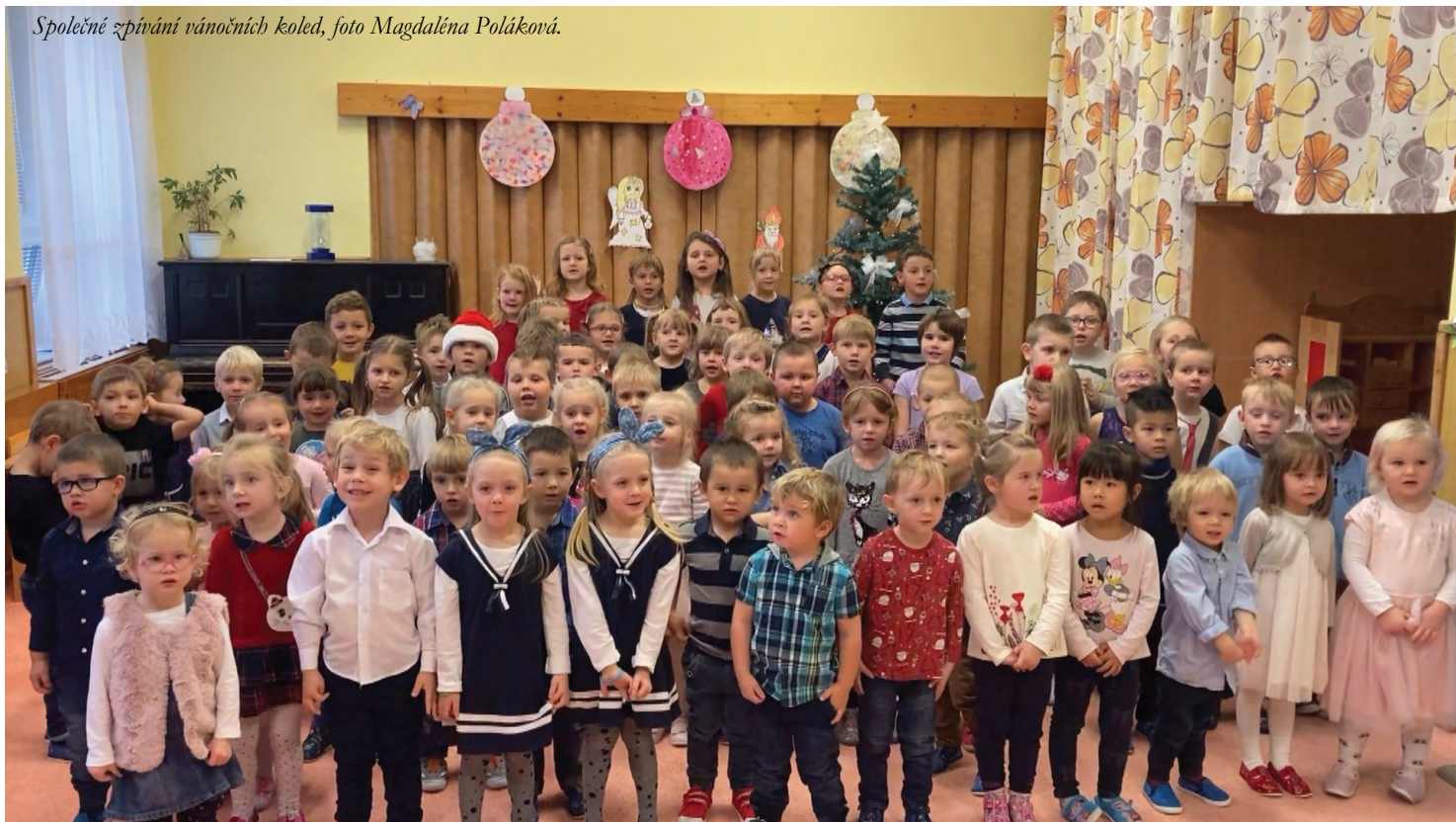
Společné zpívání vánočních koled.

Ve školce se snažíme dětem zprostředkovat, a hlavně předat informace, týkající se vánočních zvyků a tradic. Vše začíná prvním adventem, kdy s dětmi společně rozsvítíme první svíčku na adventním věnci. Ta první se jmenuje „naděje.“ Objasňujeme dětem, co to vlastně je naděje. Je přeci pěkné věřit tomu, že všechno dobře dopadne. Děti se také naučí i jména ostatních svíček, jako jsou „mír, přátelství a poslední láska.“ Společně hovoříme o tom, jak je v životě hezké mít někoho rád (ať už maminku, tatínka nebo sourozence), ale také mít kamarády. Některá přátelství trvají i celý život.